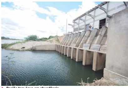
► Região tem água em abundância

Embora os irrigantes acusem o Governo do Estado de abandono, o titular da Sape conta que um escritório da Emater equipou