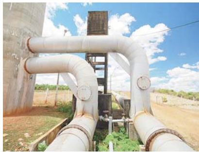
► Equipamentos de irrigação desativados

to de Irrigação do Baixo-Açu (Adiba), que prefere não se identificar, mesmo depois de ter realizado a concorrência da segunda etapa e os 29 lotes terem sido licitados, o Governo do Estado nunca entregou os títulos de posse dos terrenos. Em 2002 os três mil hectares já tinham toda infraestrutura em energia elétrica, estação de bombeamento, canais de irrigação e estradas, mas jamais foram explorados. "O governo investiu R$ 35 milhões nessa estrutura, mas não entregou as escrituras. Como as pessoas iam se instalar sem a comprovação de que a terra era delas?", questiona.