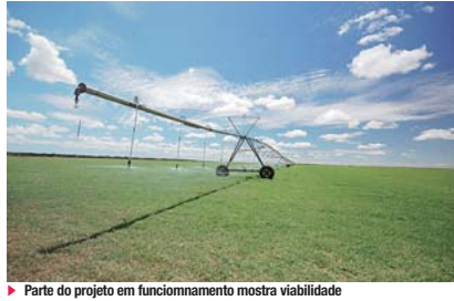
► Parte do projeto em funcionamento mostra viabilidade