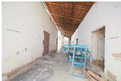
► Instalações abandonadas foram depredadas

presa de segurança equipada com motocicletas faça a vigilância do local. O Novo Jornal percorreu parte dos três mil hectares inexplorados e constatou a depredação. Toda a cadeia de postes instalada pelo Governo do Estado teve a fiação roubada, além de vários transformadores. A estação de bombeamento também foi saqueada e até a lona do canal de irrigação foi levada pelos bandidos.